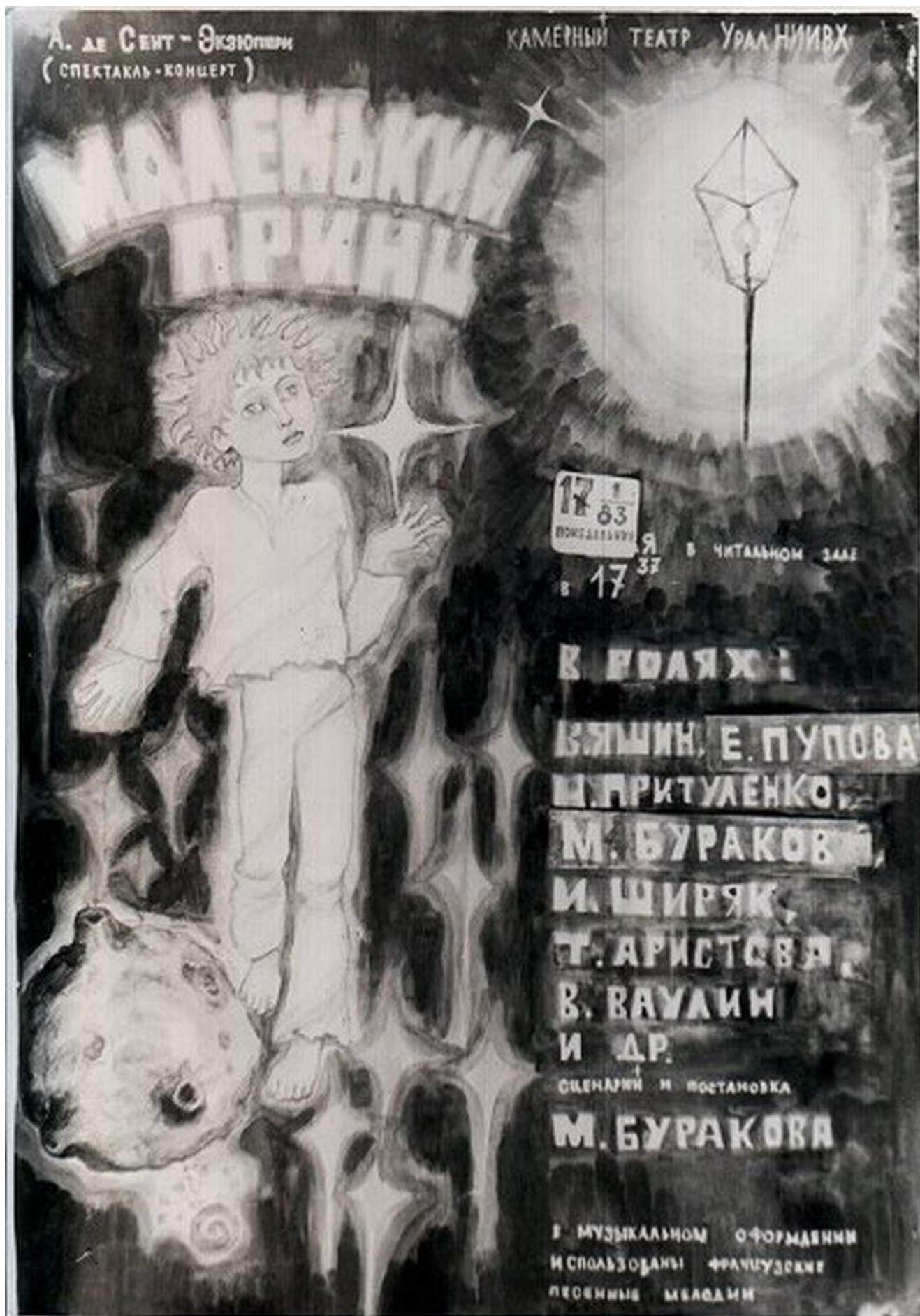
Место встречи – читалка