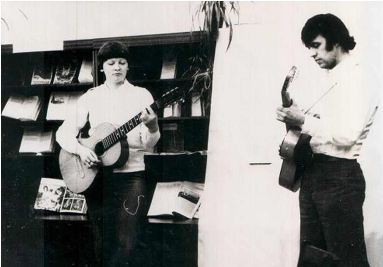
«Нас скоро сменят наши малыши»