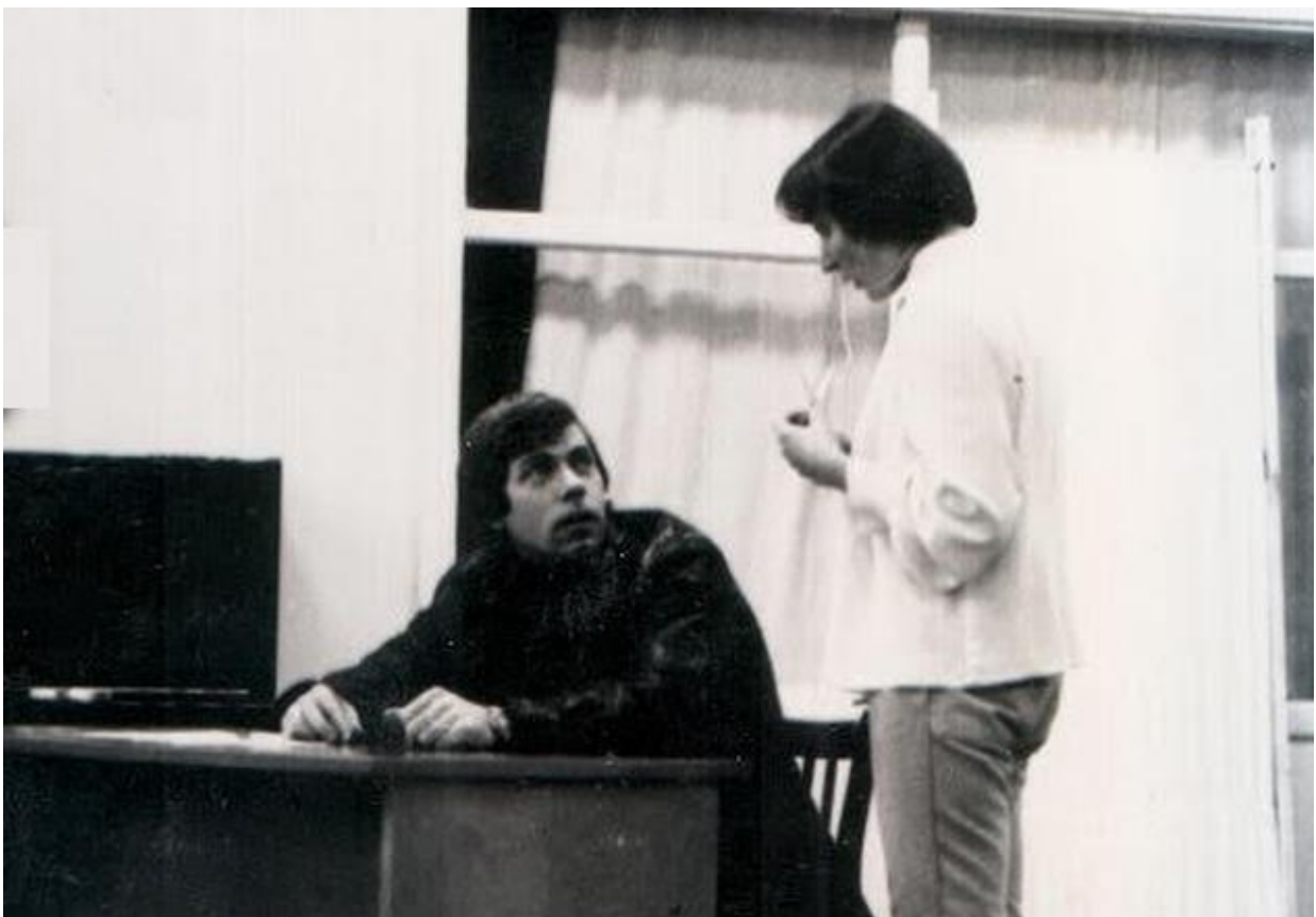
– Пожалуйста, нарисуй мне барашка!